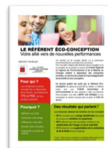
Le référent éco-conception