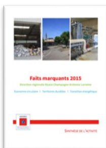
Synthèse de l'activité 2015 de l'ADEME Alsace Champagne-Ardenne Lorraine