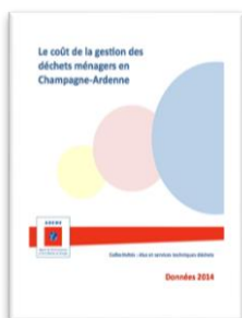
Le coût de la gestion des déchets ménagers en Champagne-Ardenne, données 2014